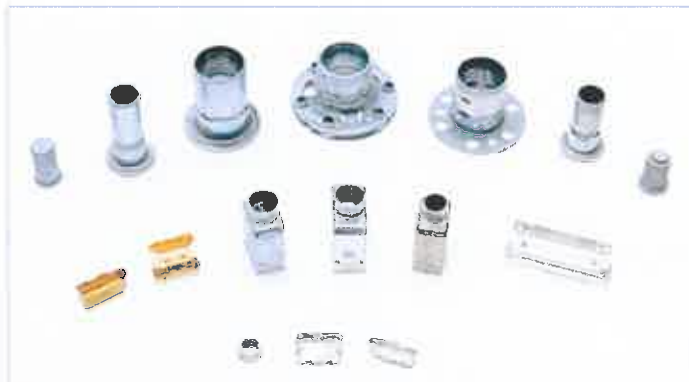
● 各類特殊拉伸零件 Specific drawing parts