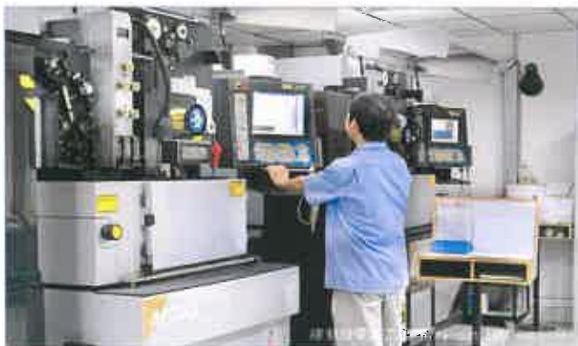
Die making workshop