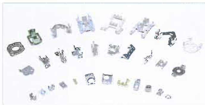
● 各類精密衝壓零件 Precision stamping parts