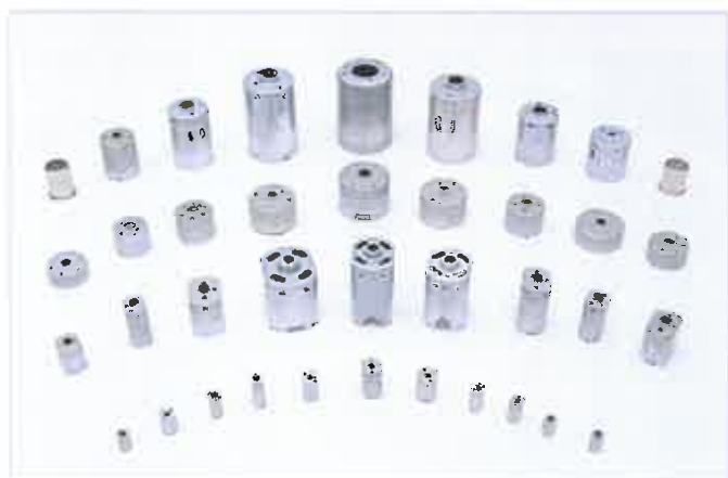
● 小型直流馬達零件 Micro DC motor case

Precision stamping process and producing high precision products are our dedication and pursuit.