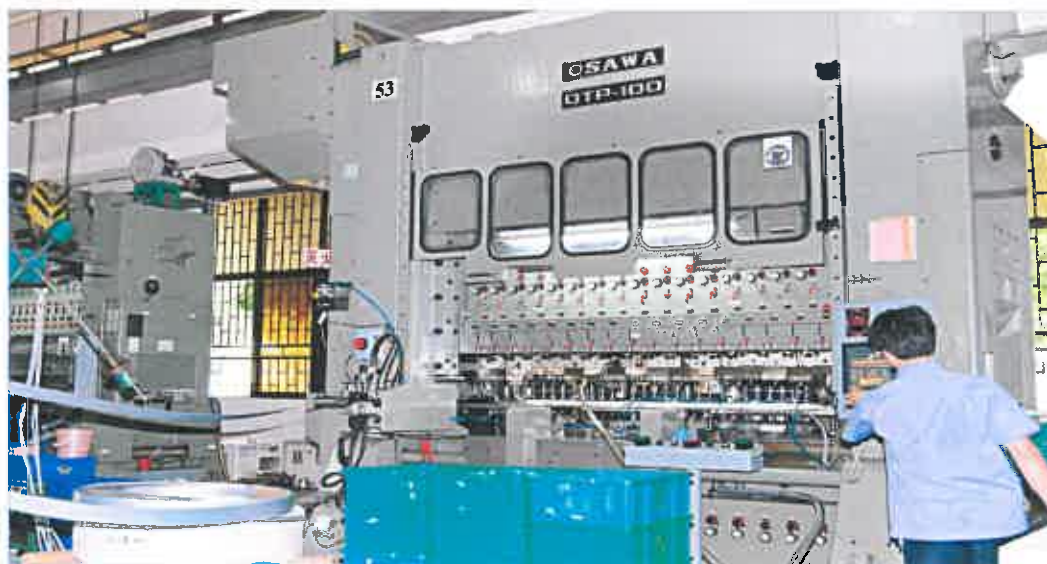
傳遞式衝床 Transfer Press

High-precision punch, first-class production technology and with sufficient productive capacity in order to complete delivery and transmission-type processing along