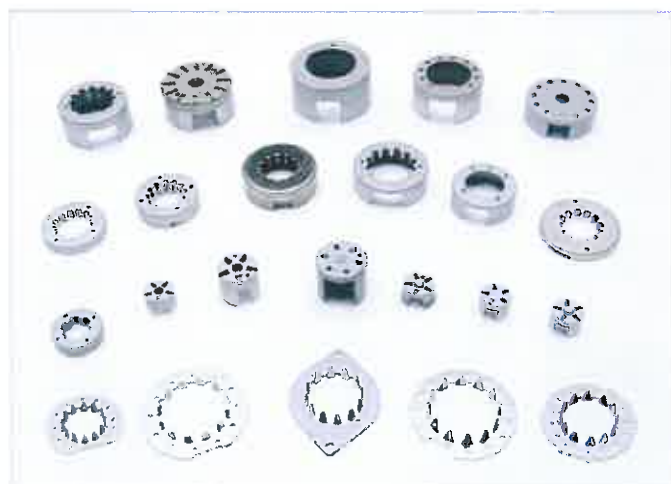
● 步進馬達零件 Stepping motor parts